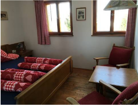
Guffert - Zimmer