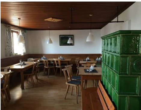
2 gemütliche Gasträume