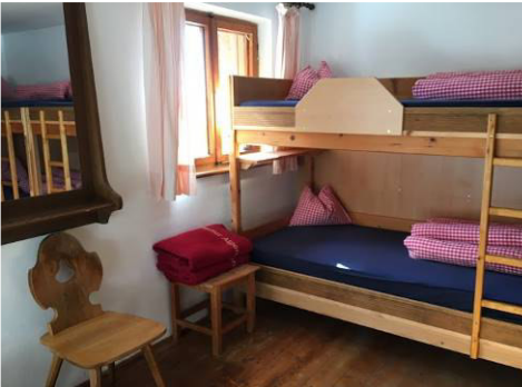
je ein 4- und ein 6 Bett-Zimmer